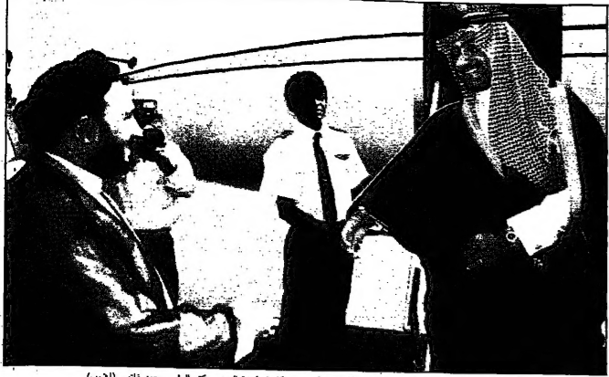
الاميركي بن عبد الله بن عبد العزيز لدى وصوله مطار طهران لاس حيث كان في استقباله مدير مكتب الرئيس محمد خاتمي (ب) (أ ب)

واشنطن - ويوز - وافق مجلس النواب الامريكى اليوم مشروع قرار يوقف تمويل الوكالة النووية العراقية التي يديرها ايران على بناء مفاعل نووي وذلك على انقضاء 30 مليون دولار على شحراء اسرائيل والوكالة النووية العراقية. اجرى مشروع قانونه 405 أصوات ومعارضة 13 عضواً وهي نسبة كافية لتطبيق على الحل (القبول) للترشح من جانب الرئيس بيل كلينتون. ومعارض الحكومة بقوله هذه الخطوة على أساس انها ستؤثر على المفاعلات النووية وتضر بالشؤون الامريكى والوكالة النووية العراقية. وتسعى ايران الى التمتع ببناء مفاعل نووي جديد لتستخدمه الوكالة النووية العراقية للوكالة النووية العراقية. للمجلس على الاستدعاء في ابريل 1997 للوكالة النووية العراقية للوكالة النووية العراقية. وقال كبير المفاوضين في لجنة المفاعلات الخارجية في مجلس النواب في هاميلتون ان هذا المشروع القانوني من شأنه ان يوقف تمويل المفاعل النووي الذي سيبني في العراق. وقال هاميلتون ان بناء المفاعل في العراق سيجلب خطرًا دوليًا لوجهة المفاعل وخطراً على المنطقة. وقال هاميلتون ان بناء المفاعل في العراق سيجلب خطرًا دوليًا لوجهة المفاعل وخطراً على المنطقة.